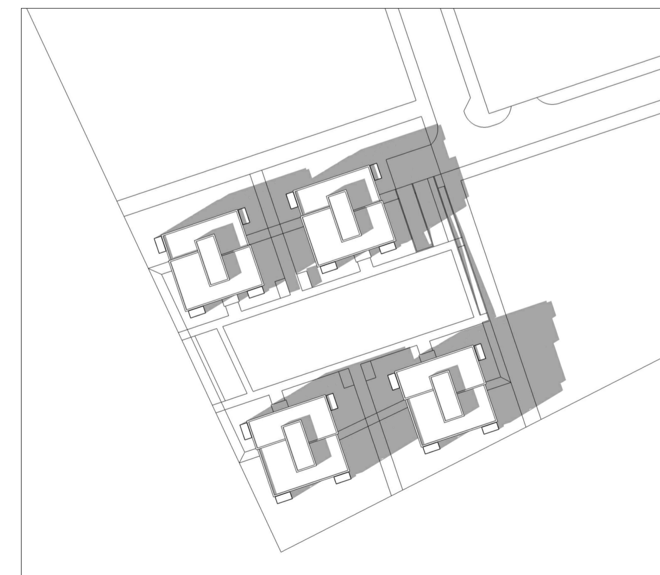
SKUGGAVARP sumarsólstöður 16.30