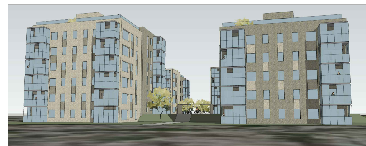
SUÐAUSTURHLIÐ frá Selhrauni að reit 2A