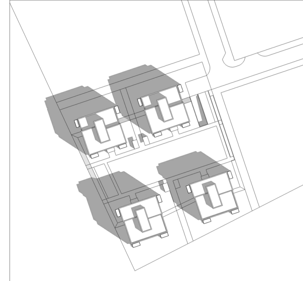
SKUGGAVARP sumarsólstöður 10.30