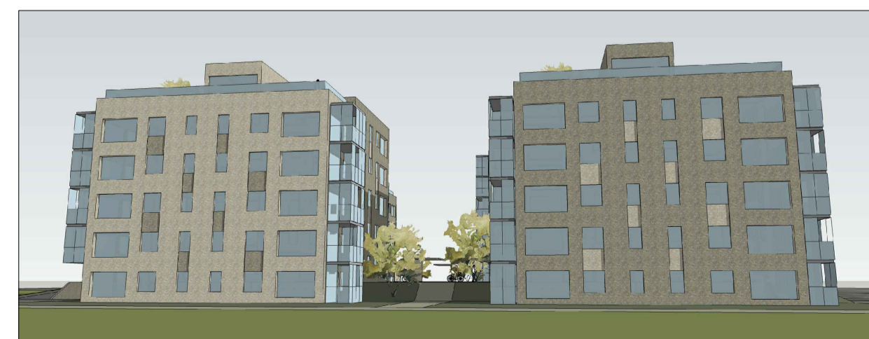
NORÐVESTURHLIÐ frá reit 2A

ÁSHAMAR REITUR 8A 221 HAFNARFIRDI DEILISKIPULAG VERK: 2105 Hamr KVARÐI: 1:500 DAGS: 03.09.2021 TEIKN: BÓS / AL SKÝRINGARUPPDRÁTTUR SKRÁ: Grunnur-1.dwg