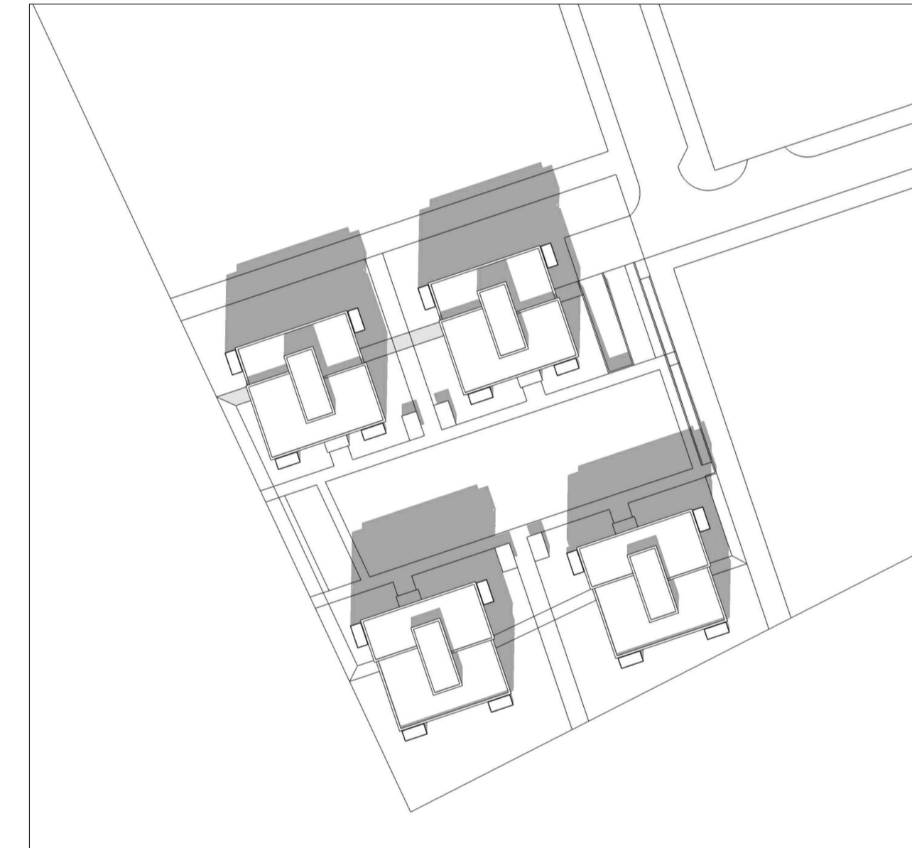
SKUGGAVARP sumarsólstöður 13.30