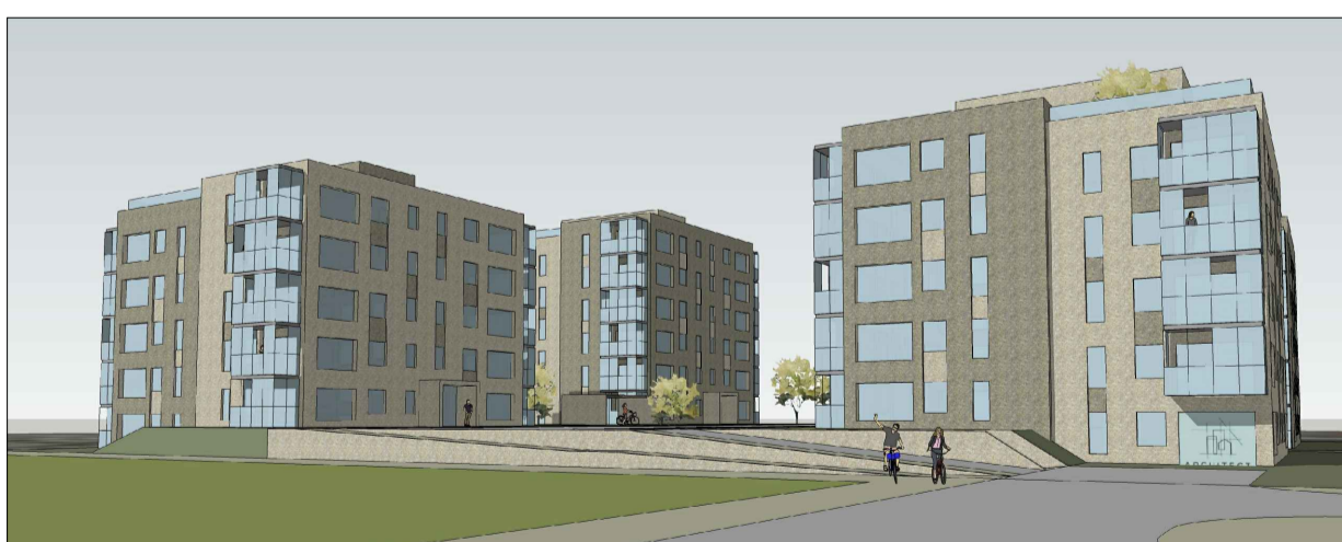
NORÐAUSTURHLIÐ frá Áshamri