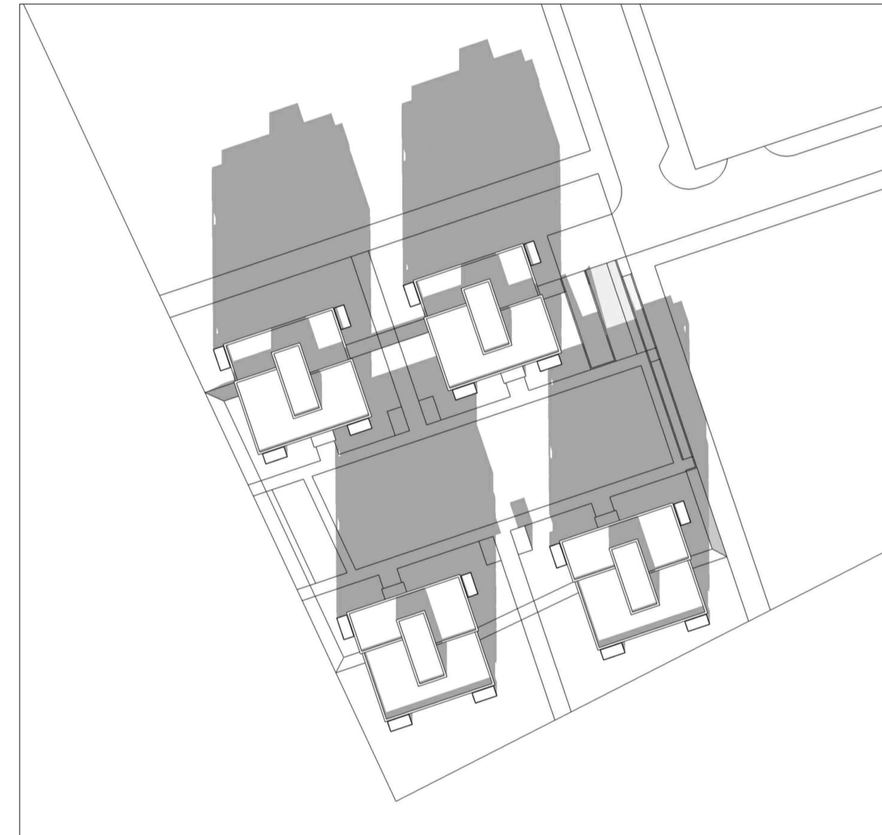
SKUGGAVARP jafndægur 13.30