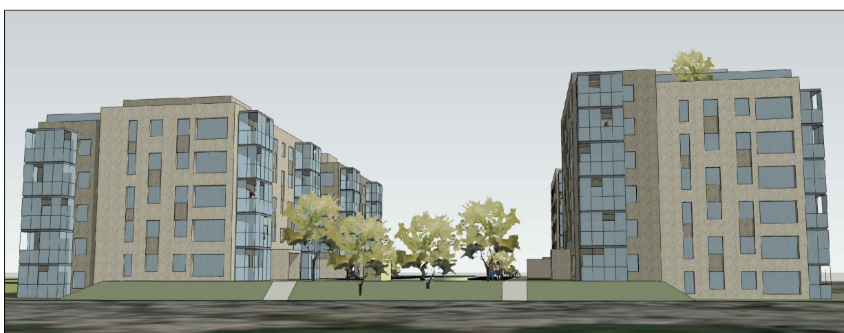
SUÐVESTURHLIÐ frá Selhrauni að reit 9A